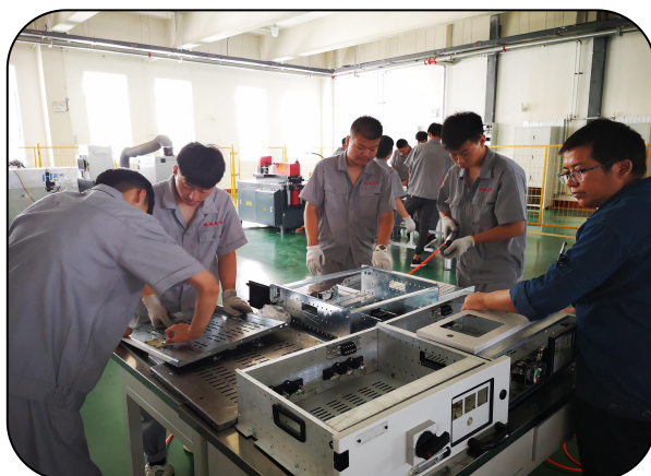
引企入校, 第二轮入驻企业

在引企入校、实训基地建设、校企共育人才等方面取得明显成效，持续强化内涵建设，提升人才培养质量。