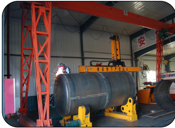
引企入校, 第一轮入驻企业